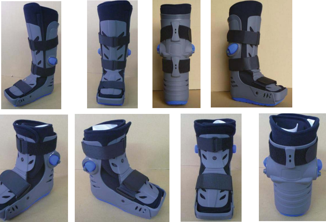
Apollo Color Requirements